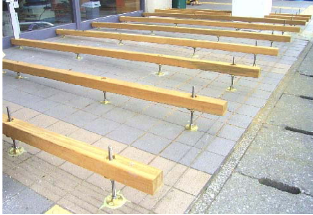
埋設固定の場合は、座金からボルトを突き出し既存の床面に開けた穴にボルトを差し込みエポキシボン드로固定