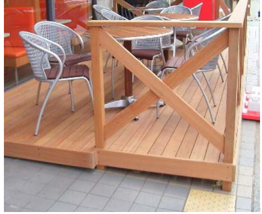
ウッドデッキが敷き込まれ完成した様子