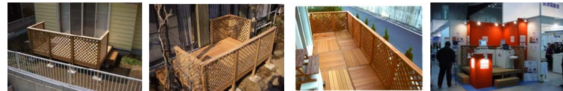
2 x 3スパン