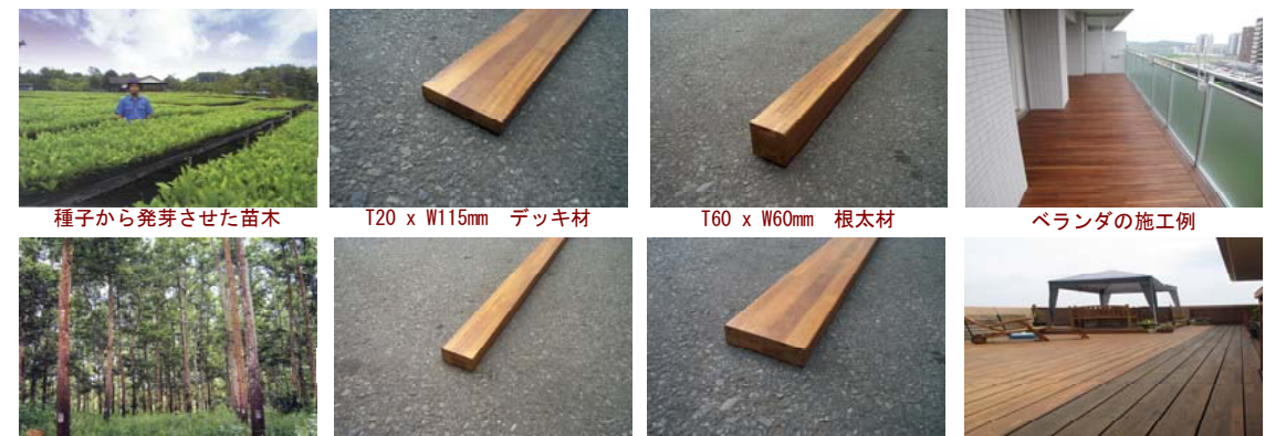
種子から発芽させた苗木