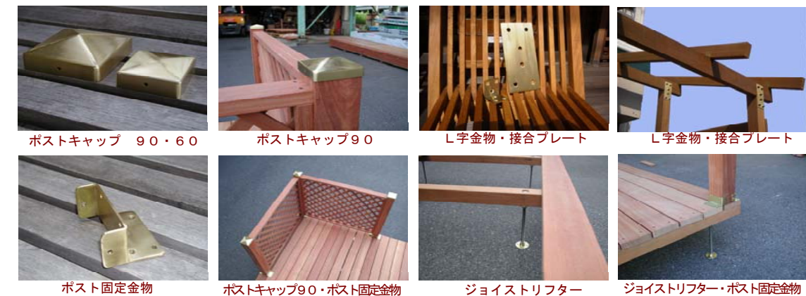
ポストキャップ 90・60