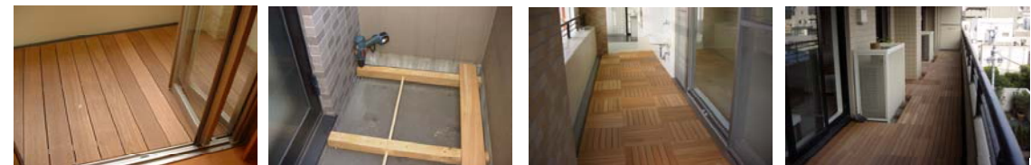
リードデッキ使用