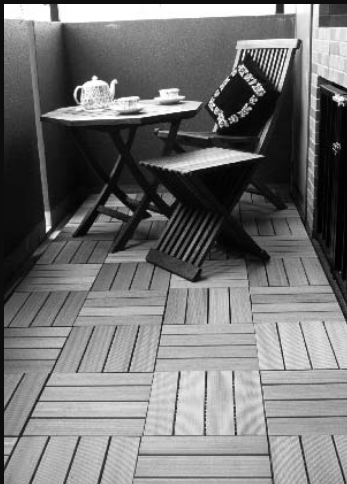
◀ 設置場所の広さに左右されない柔軟性